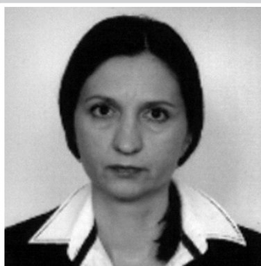
Снежана Бјелогрић Судија Општинског суда у Ивањици