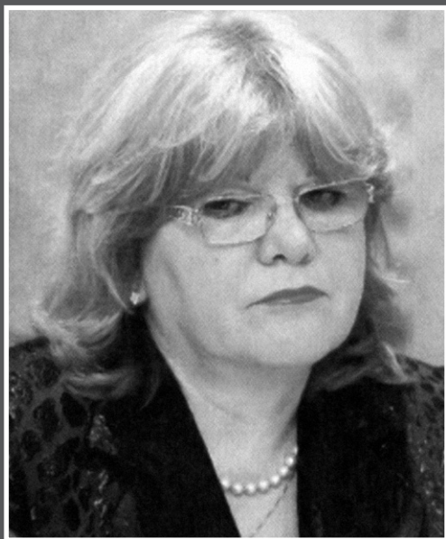
Ната Месаровић, Президент Високог савета судства