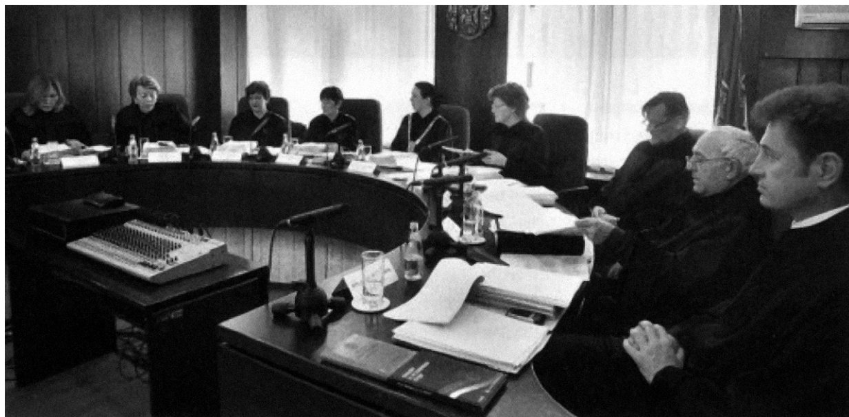
Професори и доценти: судије Уставног суда Србије

да не мора све остати на преседану, непознатом у правно уређеном свету, и да после прве наредне промене Устава, неки нови владајући политички конгломерат, надахнут новом реформаторском мисијом неће посегнути и за поновним општим избором, уносећи нову несигурност међу брижне и захвалне судије.